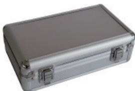
Aluminio - Plateado